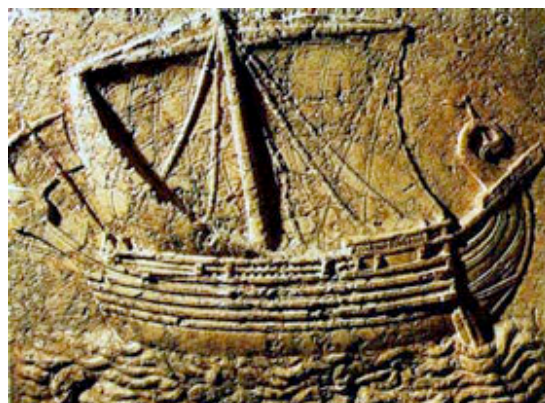
Bateau phénicien du 1 er siècle av. J.-Christ